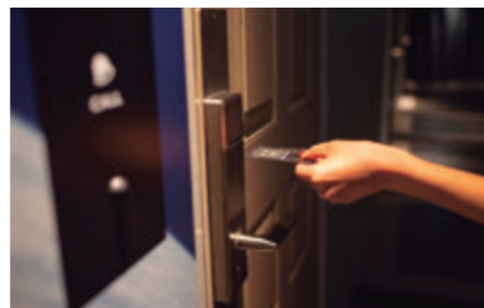
写真3 オートロック方式からカードロックキーへ変更することで自由な外出が可能となり、利用客、スタッフ双方のストレスを削減