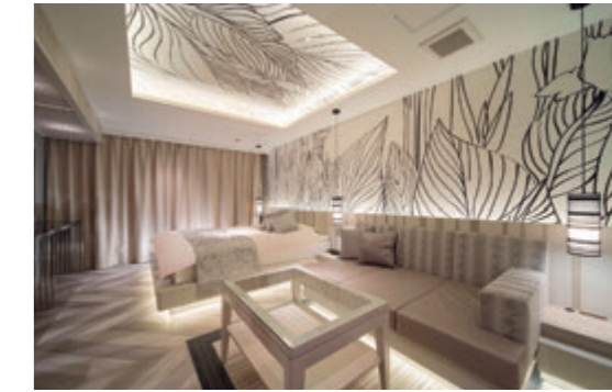
2018年の改装では、玄子空間デザイン研究所のデザイン演出のもと、客室空間のブラッシュアップも実現

（1）（2）を効率的に行なうためには、競合ホテルの状況を常に調査することも大事ですが、ホテルが立地するエリアのイベント内容を理解し、どういった層が「ホテルの予約」を求めているのか細かくリサーチすることが肝になります。チェックイン時のお客さまとの接客の際や、メールなどでもイベント情報をいただくことがあり、データとして蓄積していきます。それは次の年のレベニューマネジメント