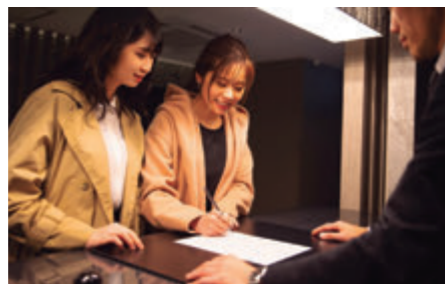
写真2 対面接客で予約管理を行なうとともに、宿泊台帳の記入も実施