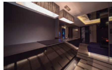
写真1 本格的な予約導入に合わせてオープンフロントを採用

なお、次号では、予約戦略の面において、サイトコントローラーやPMSを使っている、プラン作成の考え方、アピールポイントの打ち出し方、そしてさらなるレベニューマネジメントの活用法の一例といった「実践編」を、当社ホテルの取組みを中心に深掘りしていきたいと思っています。