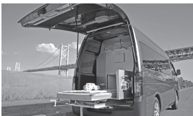
ペットセレモニー事業はペット火葬車を活用