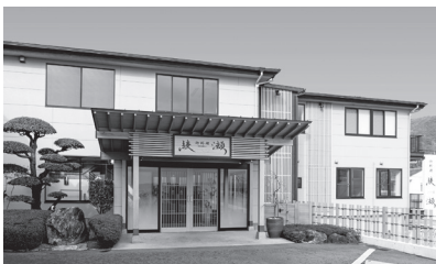
御料理綾瀬では法要、仕出し等の需要を獲得