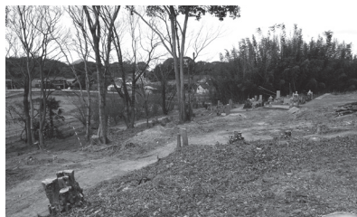
現在造成中の地元墓地敷地