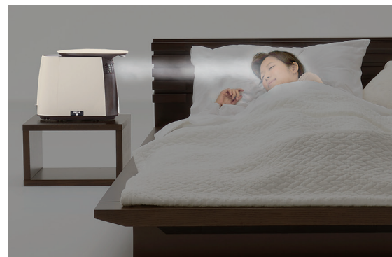
適温のスチームを顔まわりにダイレクトに届ける。エアコンの風の影響も受けにくく、ピンポイントで効率的に保湿

宿泊利用者の減少に悩むレジャーホテル業界においても「快眠空間」を打ち出すことで“選ばれるホテル”になるための一助となるだろう。