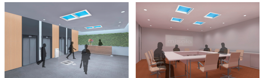
エレベーターホール、会議室等様々な場所での利用が想定される

の移り変わりを感じ、開放的な気分を味わえるようになってきているという。今後は地下通路や地下街、会議室、エレベーターホールなどへの導入も視野に入れている。病院や託児所、老健施設などでも人気は高まりそうだ。